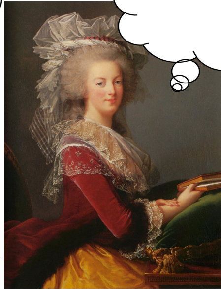
Domaine public / Wikimedia